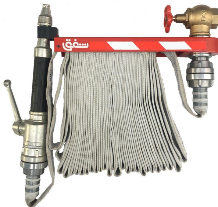
هوزرک شیلنگ تخت آتش نشانی شفق