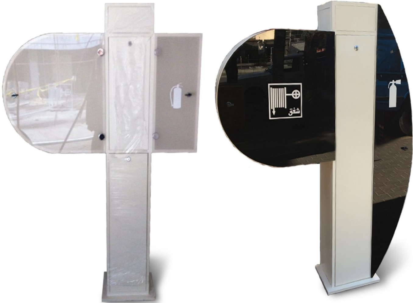
مدل: Prestige / پرستیژ